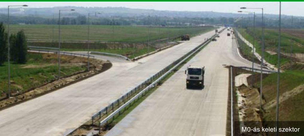
M0-ás keleti szektor